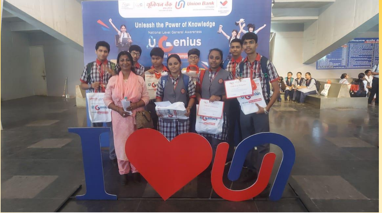
अहमदाबाद में यूनियन बैंक ऑफ इंडिया द्वारा प्रश्नोत्तरी प्रतियोगिता