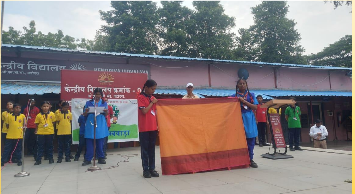
एक छात्र द्वारा कपड़ा बुनाई का अनुभव साझा किया गया